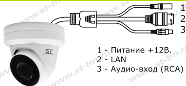
Рис.1 Схема подключения видеокамеры