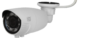
Рис. 1 Схема подключения видеокмеры