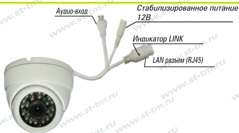
Рис. 1 Схема подключения видеокмеры