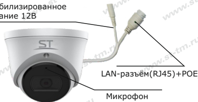
Рис.1 Схема подключения видеокмеры