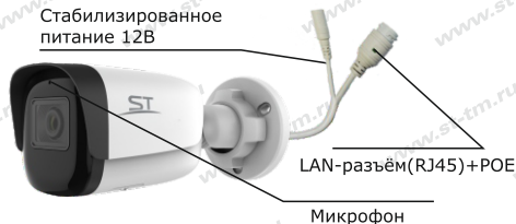
Рис.1 Схема подключения видеокмеры