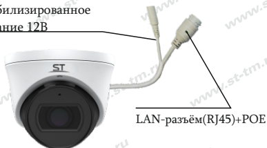
Рис.1 Схема подключения видеокamеры