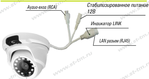
Рис. 1 Схема подключения видеокмеры