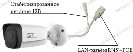
Рис.1 Схема подключения видеокмеры