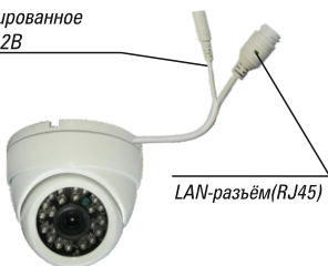
Рис. 1 Схема подключения видеокамеры