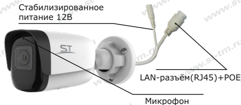
Рис.1 Схема подключения видеокмеры