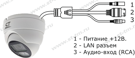
Рис. 1 Схема подключения видеокамеры