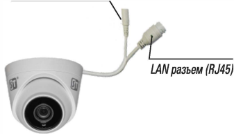
Рис. 1 Схема подключения видеокмеры