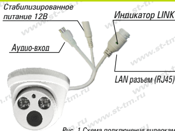
Рис. 1 Схема подключения видеокамеры