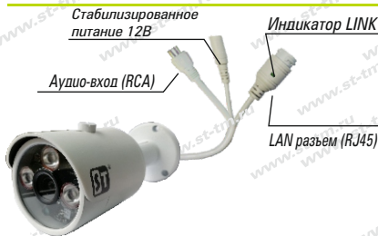
Рис. 1 Схема подключения видекамеры