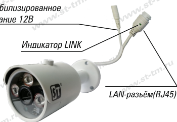
Рис. 1 Схема подключения видеокмеры