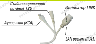
Рис. 1 Схема подключения видеокмеры