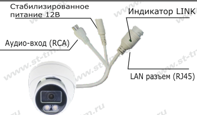
Рис. 1 Схема подключения видеокамеры